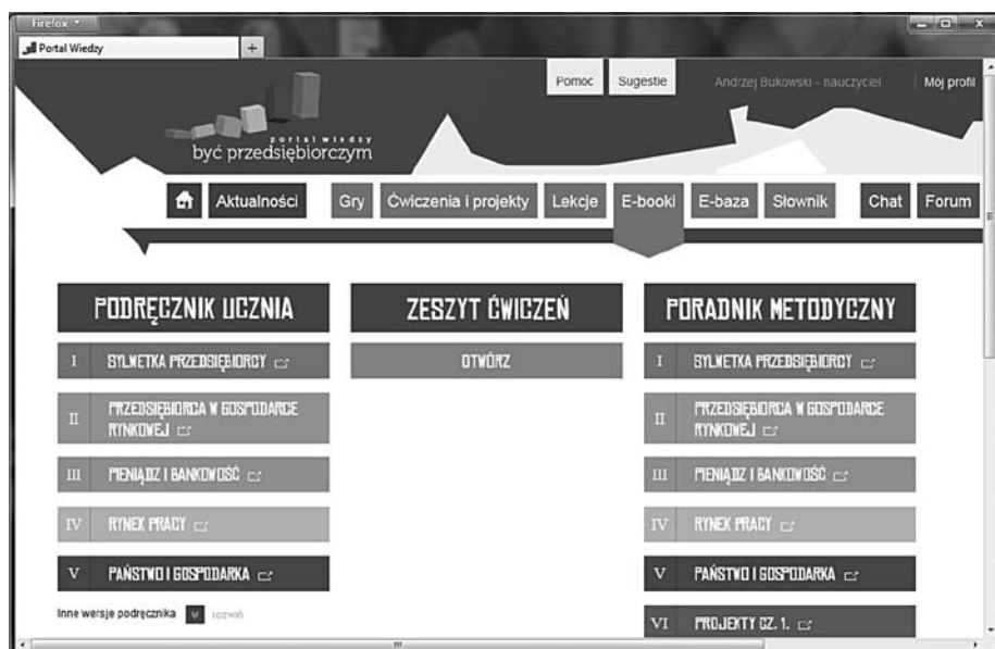
Rysunek 5.1. E-booki dostępne na platformie

E-podręcznik przeznaczony jest dla uczniów i nauczycieli, ma zawierać treści przekazywane w ciekawy sposób, w formie interaktywnej. Forma podręcznika ma pozwolić uczniowi na samodzielne korzystanie z niego zarówno na lekcji, jak i po zajęciach lekcyjnych, umożliwiając naukę przez działanie (rysunek 5.1).