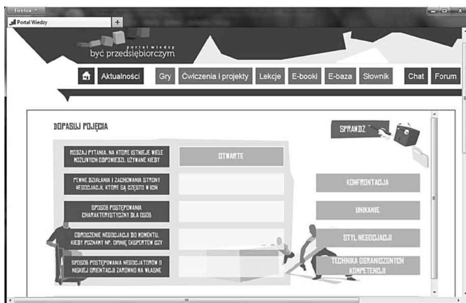
Rysunek 5.3. Ćwiczenia na portalu Być przedsiębiorczym

Zestawy zadań – ćwiczenia, materiał przeznaczony dla nauczycieli do pracy z uczniami w trakcie lekcji i zadawania prac domowych (rysunek 5.3).