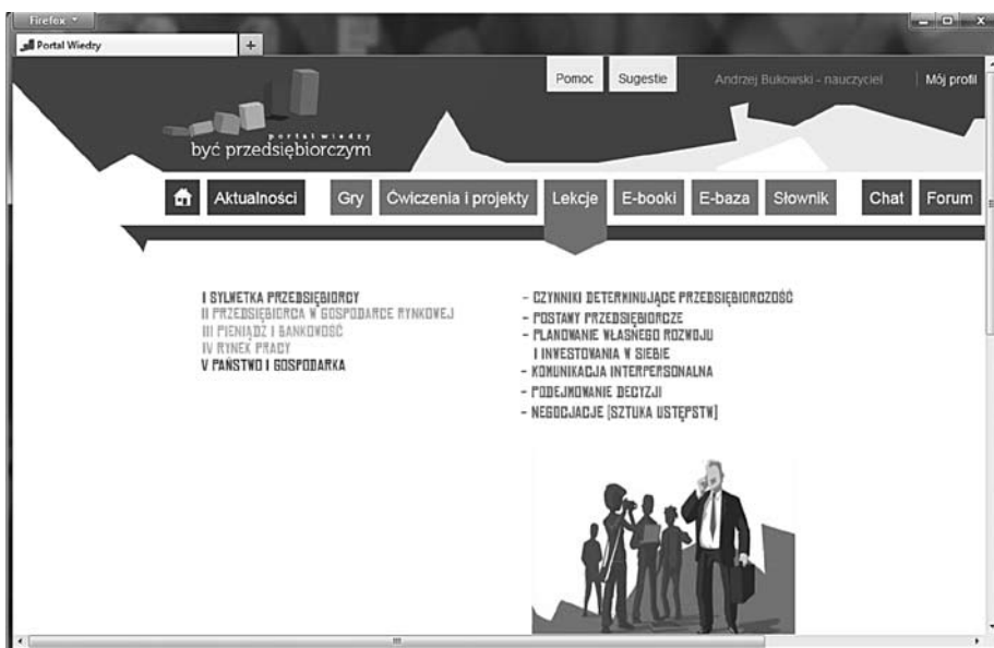
Rysunek 5.2. Lekcje (prezentacje dla nauczycieli)

W badaniu odniesiono się do prezentacji multimedialnych zamieszczonych na Portalu Wymiany Wiedzy do wykorzystania przez nauczycieli na lekcjach – zgodnie z założeniami przyjętymi w projekcie.