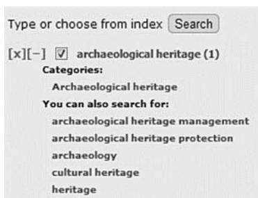
Rysunek 10.3. Mechanizm podpowiadający słowa podobne podczas indeksowania zasobów w repozytorium

W celu zwiększenia efektywności procesu indeksowania i przeszukiwania zasobów do Content Repository Tool został wprowadzony tzw. Enhanced tagging system (Marciniak, 2011). Dzięki temu mechanizmowi użytkownik indeksujący zasoby (tzn. przypisujący do nich tagi) lub przeszukujący zasoby po tagach, uzyskuje dostęp do mechanizmu podpowiadającego słowa podobne (rysunek 10.3). Aby było to możliwe, mechanizm ten musi zostać zasilony ontologią typu wordnet poszerzoną o relacje dziedzinowe (wordnet based ontology with expert knowledge) (Marciniak, 2011). W przypadku repozytorium E-archaeology Content Repository system został zasilony ontologią Protection and management of archaeological heritage ontology , która zawiera ok. 1500 pojęć i 150 kategorii dziedzinowych.