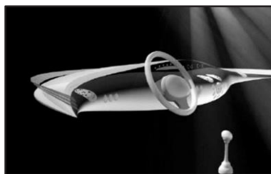
Wizualizacja elementu tablicy rozdzielczej samochodu [4]